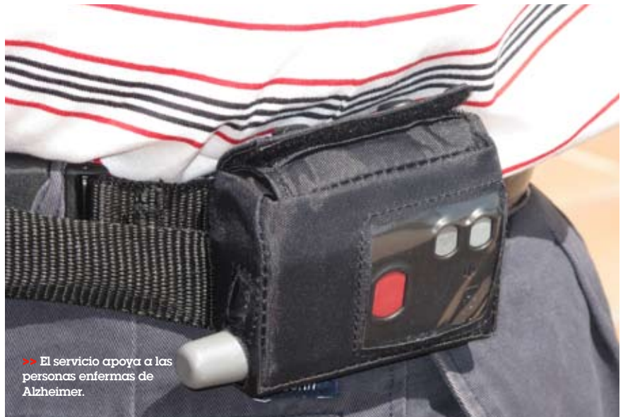
>> El servicio apoya a las personas enfermas de Alzheimer.

El funcionamiento es muy sencillo. El portador del aparato, similar a un teléfono móvil, está siempre localizable gracias a un sistema de GPS; los familiares o cuidadores pueden acceder a la localización del terminal las 24 horas conectándose telefónicamente con Cruz Roja o accediendo directamente a la plataforma SIMAP desde un móvil o intranet.