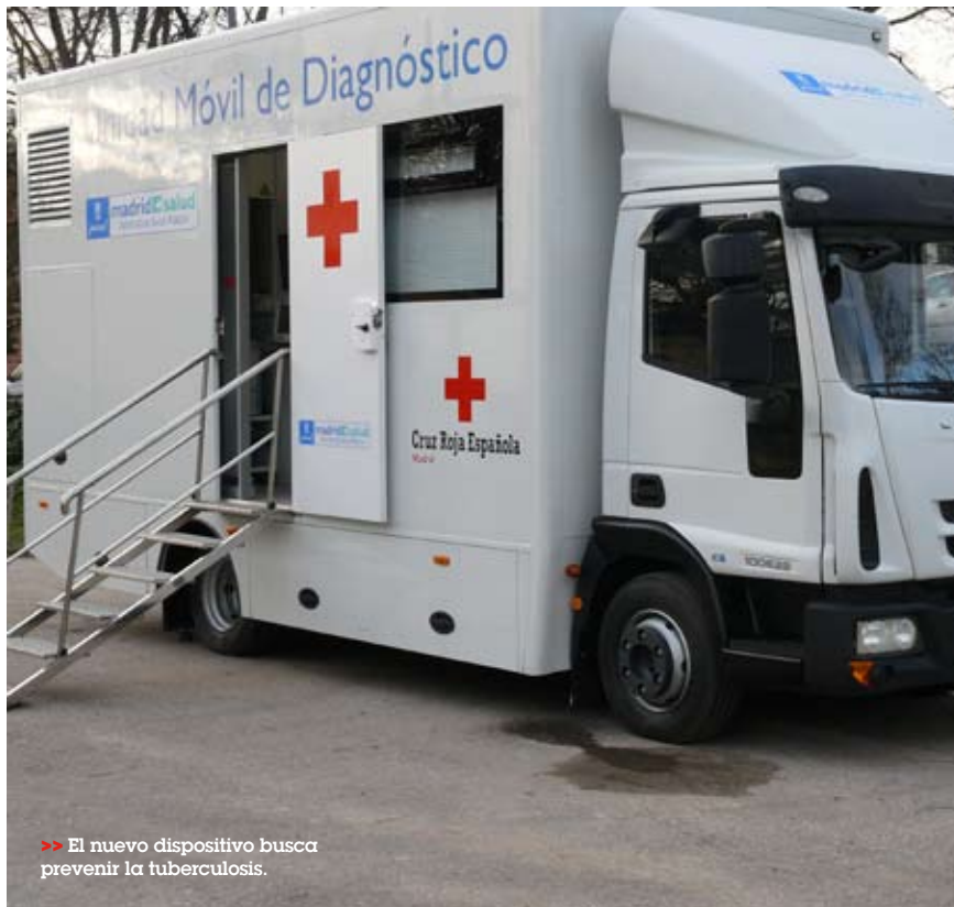
>> El nuevo dispositivo busca prevenir la tuberculosis.